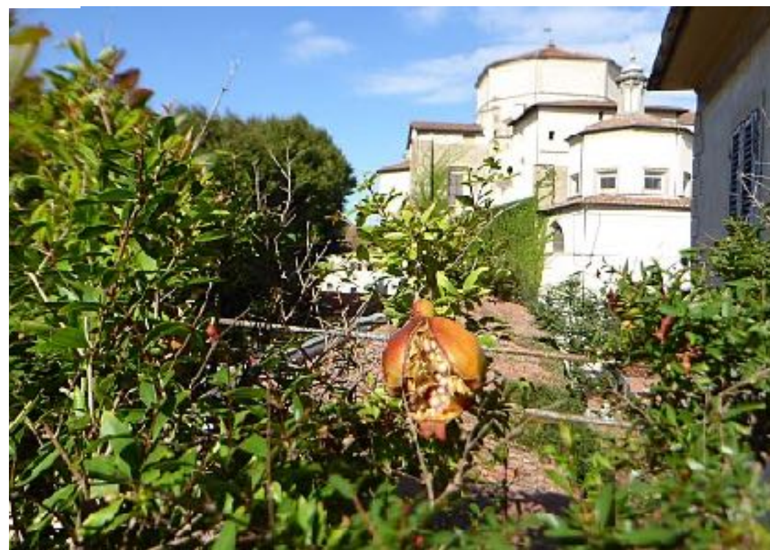
Giardino in via dell'Ardiglione. Anni 50-60