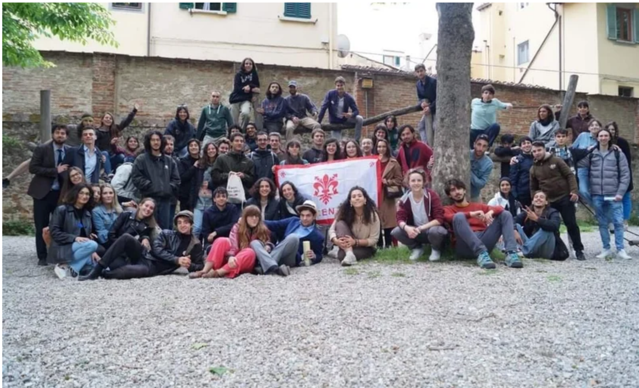
The members of the Giardino association